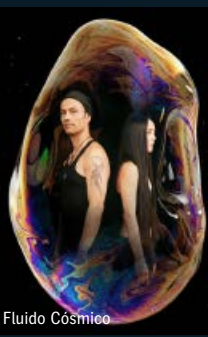
FisFüz and guests