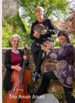
Trio Aman Aman