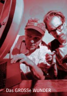
Das GROSSE WUNDER